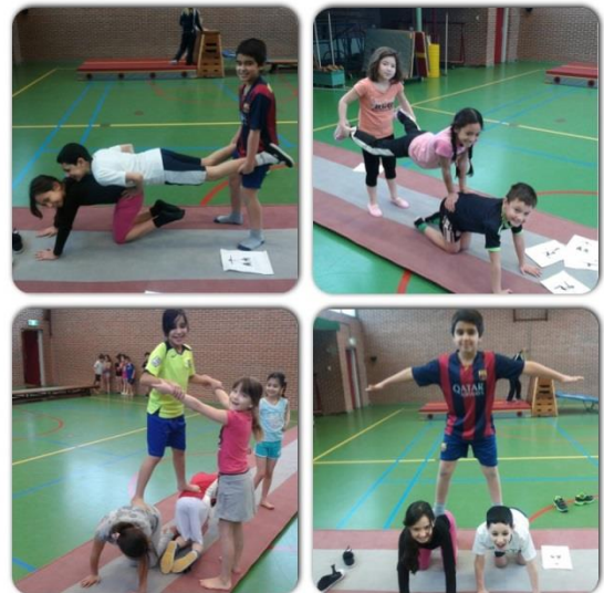
De kinderen van groep 4 en 5 doen acrobatische kunsten, knap hoor.