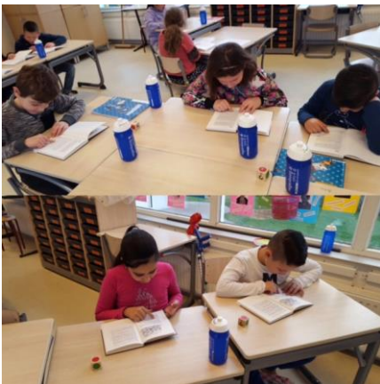
Duolezen in groep 5, wat gaat dat goed zeg. Opsteker voor iedereen!