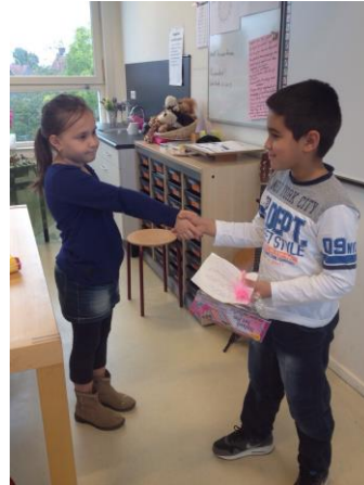
De Vreedzame School is ook: sorry zeggen en een excuusbrief schrijven!