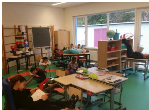
Tijdens de Kinderboekenweek lekker, ontspannen lezen. Zo doen de kinderen van groep 6 en 7 dat.