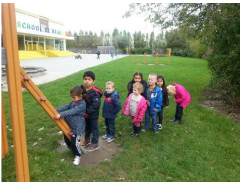
Netjes wachten in de rij op je beurt. De kinderen van groep 1/2A doen dat supergoed.