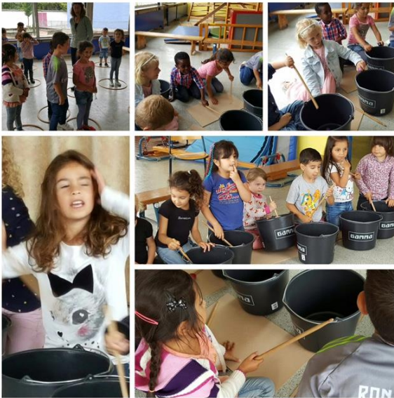
Groep 1/2A heeft genoten van een uitdagende muzikles van de Plantage. Groep 1/2B komt natuurlijk ook nog aan de beurt.