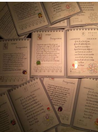
Wat hebben de kinderen van groep 5 weer mooi geschreven. De juf heeft bijna geen stickers meer! Als je 5 stickers hebt dan mag je met een gekleurde pen schrijven!