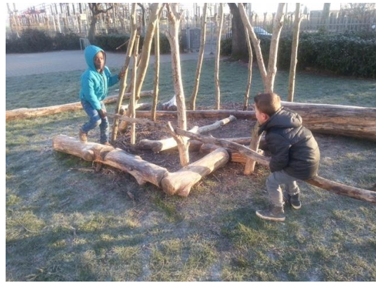
Een lesje in de klas over zwaar, licht en even zwaar. Hoe kun je dat meten? Leuk dat de kinderen dit meteen gaan toepassen tijdens het buitenspelen. Spelen is leren!