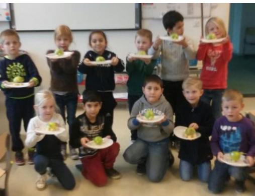
De kinderen van groep 3 hebben geknutseld met fruit: ze maakten een schildpad van appel, druiven en blokjes kaas. Leuk en lekker!