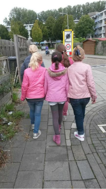
De kinderen van groep 6 hebben goed geholpen met flyeren voor het Brede School evenement. Fijn!