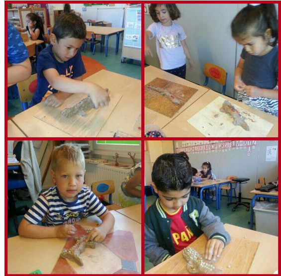
Deze kinderen genieten van een opdracht, een kunstwerk van klei maken zoals de kunstenaar Gaudi. De resultaten zijn erg mooi.